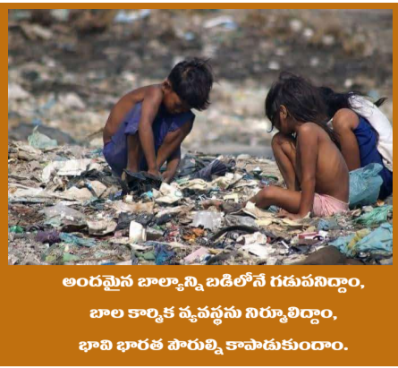
అందమైన బాల్యన్ని బడిలోనే గడుపుకొంటుంది. బాల కార్మిక వృత్తాన్ని నిర్మూలించాలి. భావి భారత పౌరుల్ని కాపాడుకుందాం.