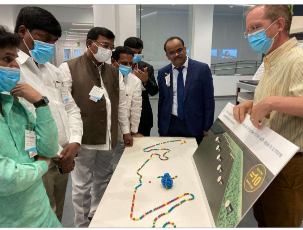
(మొదటి పేజీ తరువాయి) అనుకూలమని వెల్లడించారు. దేశంలో 2030 నాటికి పత్తి ఉత్పత్తి 7.2 మిలియన్ టన్నులకు చేరుందన్నారు. 2002 నుంచి పురుగులను తట్టుకునే బోల్గార్ రకం హైబ్రిడ్ పత్తి సాగుతుందని, దీంతో పంట ఉత్పాదకత పెరిగింది తెలిపారు. జేయర్ విత్తన సంస్థ అనేక దేశాల్లో పరిశోధనలు జరిపి అక్కడి వాతావరణ, భూ పరిస్థితులకు అనుకూలమైన ఎక్కువ దిగుబడినిచ్చే రకాలను అందిస్తున్నదని చెప్పారు. పత్తిసాగులో పెట్టుబడి వ్యయం తగ్గించడం, ఉత్పాదకత పెంచడంతోపాటు పంటకోతలో ఉన్న నమస్థలను సరళీక రించేందుకు అమెరికాలో అధ్యయనం చేస్తున్నామని వెల్లడించారు. తెలంగాణకు పత్తి, మొక్కజొన్న, కూరగాయల రకాల్లో సాతన వంగడాలను అందించేందుకు జేయర్ సంస్థ సంస్థిత వ్యక్తమేనందన్నారు. అమెరికాలో వ్యవసాయ కమిషన్లు పెద్దవికావడంతో వారు యాంత్రికరణతో అన్నితాలు సృష్టిస్తున్నారని తెలిపారు. తక్కువ విస్తీర్ణంలో తక్కువ రోజుల్లోనే అధిక ఉత్పత్తి సాధిస్తున్నారని చెప్పారు. తెలంగాణ ప్రభుత్వం కూడా పత్తి సాగు, వ్యవసాయంలో యాంత్రికరణను ప్రోత్సహిస్తుందన్నారు.