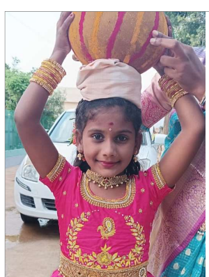
అబ్రహీంపట్నం, ఆగస్టు 22 (సమ సమాజం): రంగారెడ్డి జిల్లా అబ్రహీంపట్నం యాచారం మండలం పరిధిలోని మేడిపల్లి గ్రామం లో కన్నుల పండుగం మండల గ్రామ నిర్వహించారు. భారతీయ సంస్కృతిని మరచకుండా తెలంగాణలో ఆదర్శంగా పుట్టి ప్రత్యేక ఆలంకరణలో అంగరంగ వైభవంగా పెద్దమ్మ తల్లికి బోనాలు సమర్పించారు. ఈ సందర్భంలో సుందీ మనందరినీ కాపాడిన పెద్దమ్మ తల్లికి ధూప దీప నైవేద్యాలను పోతురాజుల విన్నపాలతో అమ్మవారికి బోనం, మొకుల్లులను చెల్లించాలి. గ్రామంలోని ప్రజలందరికీ పెద్దమ్మ తల్లి దీవెన ఎల్లప్పుడూ ఉంటుంది ఆ అమ్మవారి కరుణ కడకొరలు గ్రామ ప్రజలు సుఖ సంతోషాలతో ఆత్మైక్యాలతో ఆయురారోగ్యాలతో సుఖంగా ఉండాలని బోనం సమర్పించిస్తుంది తెలిపారు.