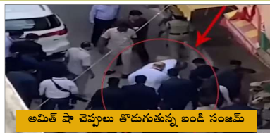
అమిత్ షా చెప్పలు తొడుగుతున్న బండి సంజయ్