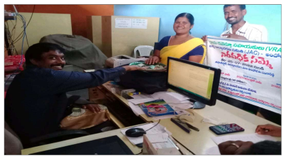
ఆంధోల్-జోగిపేట్, ఆగస్టు 22 (సమ సమాజం): పాపం దిన్నస్థాయి ఉద్యోగులకు కష్టం వచ్చింది. అన్ని పనుల్లో మేమున్నామంటూ ముందుండే గ్రామ రెవెన్యూ సహాయకులకు ముఖ్యమంత్రి అసెంబ్లీ సాక్షిగా గౌరవ వేతనంతో కూడిన అన్ని సౌకర్యాలను కల్పిస్తామని హామీ ఇచ్చారు. ఈ నేపథ్యంలో

రాష్ట్రవ్యాప్తంగా వీఆర్ఎల నిరసనకు సమైక్య కార్యక్రమానికి శ్రీకారం చుట్టారు. ఆ సమైక్య 29వ రోజుకు చేరుకున్న ఏ ఒక్క అధికారి స్పందించిన రాజులూ లేవని వారు ఆవేదన వ్యక్తం చేస్తున్నారు. సంగారెడ్డి జిల్లా ఆంధోల్ మండల గ్రామ రెవెన్యూ సహాయకులు జోగిపేట పట్టణంలోని తహసీల్దార్ కార్యాలయం ఆవరణ పక్కన సమస్యలు పరిష్కరించాలంటూ సమైక్య కొనసాగిస్తున్నారు. ఈ నేపథ్యంలో భాగంగా సోమవారం మండల వీఆర్ఎల తహసీల్దార్ కార్యాలయం నుండి జోగిపేటపట్టణంలోని వ్యాపారులతో పాటు అన్ని ప్రభుత్వ సంస్థలలో భిక్షాటన చేస్తూ వారు నిరసన వ్యక్తం చేశారు. ఇప్పటికైనా ప్రభుత్వం స్పందించి మాకు ఇస్తామన్న హామీ నెరవేరాలని వారు ఈ సందర్భంగా కోరుతున్నారు.