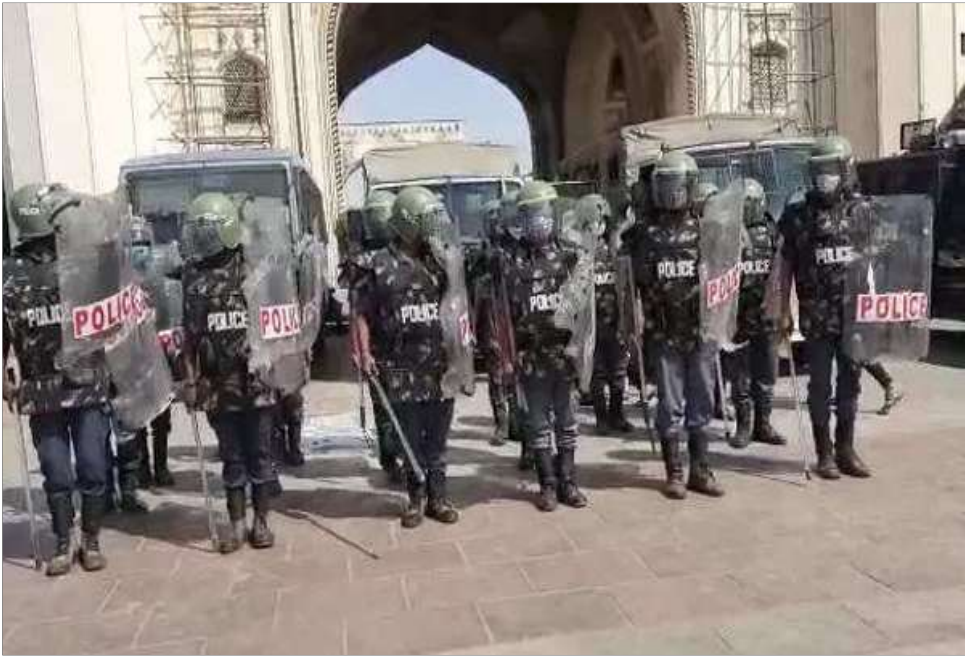
కర్నూలు తలపిస్తున్న వాతావరణం 360 మందితో మొహరించిన అర్బిఎఫ్? బలగాలు