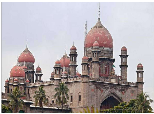
అనుమతించిన రాష్ట్ర హైకోర్టు నేటి నుంచి తిరిగి ప్రారంభించనున్న బండి