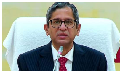
స్పష్టం చేసిన సీజీబి ఎన్టీ రమణ నేతృత్వంలోని ధర్మాసనం విచారణకు కేంద్రం సహకరించలేదని చీఫ్ జస్టిస్ వివరణ

నేతృత్వంలోని ధర్మాసనం ఈ రోజు విచారించింది. 29 ఫోన్లను పరిశీలించగా.. 5 ఫోన్లలో మాల్వేర్లు గుర్తించిన వని.. అయితే పెగాసస్ సైవేర్ కు సంబంధించి ఎలాంటి రుజువు లేదని చీఫ్ జస్టిస్ ఎన్టీ రమణ పేర్కొన్నారు. అయితే ఈ విచారణ సమయంలో భారత ప్రభుత్వం తమకు సహకరించలేదని కమిటీ సుప్రీంకోర్టుకు వెల్లడించింది. రాజకీయ నాయకులు, జర్నలిస్టులు, హక్కుల కార్యకర్తల ఫోన్లను ట్రాక్ చేసేందుకు కేంద్ర ప్రభుత్వం పెగాసస్ సైవేర్ ను ఉపయోగిస్తోందని వివక్షలు ఆరోపించిన నేపథ్యంలో సుప్రీం కోర్టు సాంకేతిక కమిటీని ఏర్పాటు