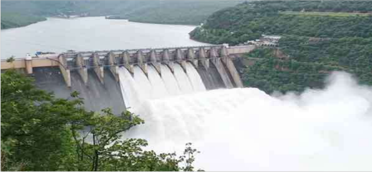
నల్గొండ, ఆగస్ట్ 25 (సమ సమాజం): నాగార్జునసాగర్ కు వరద కొనసాగుతుంది. ఎగువ ప్రాంతాల్లో కురుస్తున్న భారీ వర్షాలతో ప్రాజెక్ట్ లకు వరద నీరు భారీగా వచ్చి చేరుతుంది. అప్రమత్తమైన అధికారులు సాగర్ 6 గేట్లు ఎత్తి దిగువకు నీటిని విడుదల చేశారు. నాగార్జునసాగర్ ఇన్ఫ్లో, ఔట్ఫ్లో -లో 99 వేల క్యూసెక్కులుగా ఉంది. సాగర్ పూర్తిస్థాయి నీటిమట్టం 590 అడుగులు కాగా, ప్రస్తుతం 585.60 అడుగులుగా కొనసాగుతుంది. నాగార్జునసాగర్ పూర్తిస్థాయి నీటినిల్వ 312 టీఎంసీలుగా ఉండగా, ప్రస్తుతం 299.1660 టీఎంసీలుగా ఉంది.