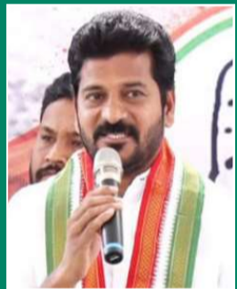
మిడ్మానేరు నిర్వాసితులపై లాభి ఇదేదా రైతు సంక్షేమం అంటూ రేవంట్ డ్యేట్ 2వ