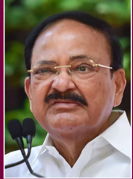
భాషా సంస్కృతులే మన చిరుగామా భాషా దినోత్సవ శుభాకాంక్షలు తెలిపిన వెంకయ్య 2వ

పెద్దపల్లి, ఆగస్టు 29 (సమ సమాజం): బిజెపి ముక్త భారత్ కావాలంటూ సిఎం కేసీఆర్ పిలుపునిచ్చారు. దేశాన్ని కార్పొరేట్ గద్దలకు దోచి పెడుతున్న బీజేపీ అవినీతి గద్దలను గద్దె దించి.. వారి నుంచి ఈ దేశానికి విముక్తి పలుకాలని ముఖ్యమంత్రి కేసీఆర్ అన్నారు. గత ఎనిమిదేళ్లుగా దేశానికి ఒక్కటంటే ఒక్క మంచి పని చేయకపోగా.. దేశాన్ని దివాళా తీయిస్తున్నారని ప్రధాని నరేంద్ర మోడిపై ప్రత్యక్ష దాడికి దిగారు. గుజరాత్ మోడల్ అని చెప్పి ఈ దేశాన్ని మోసం చేశారని కేసీఆర్ ధ్వజమెత్తారు. పెద్దపల్లి జిల్లాలో సమీకృత కలెక్టరేట్ భవనాన్ని ప్రారంభించిన అనంతరం ఆక్టోబర్ 15న బహిరంగ సభలో సిఎం ప్రసంగించారు. పెద్దపల్లి జిల్లా అవుతుందని మనం కలలో కూడా అనుకోలేదు. తెలంగాణ ఏర్పడని కాలాల్లో పెద్దపల్లిని జిల్లా చేసుకున్నాం. అద్భుతమైన కలెక్టరేట్ను ఏర్పాటు చేసుకున్నాం. జిల్లా ప్రజాప్రతినిధులను, అధికార యంత్రాంగాన్ని ప్రజలందరినీ పూర్వంపూర్వం అభినందిస్తున్నాను. చాలా మంచి కార్యక్రమాలు చేసుకున్నాం. పేదలు, రైతులు, ప్రజలు, మహిళలు గురించి మంచి కార్యక్రమాలు చేసుకుంటూ ముందుకు పోతున్నాం. భారతదేశమే ఆశ్చర్యపోయే విధంగా.. అద్భుతమైన పద్ధతిలో మనం ముందుకు వెళ్తున్నామని కేసీఆర్ పేర్కొన్నారు. ఈ ప్రాంతం గురించి మాకు తెలుసు. సింగరేణిలో వేల మందికి డిపెండెంట్ ఉద్యోగాలు దొరకుతున్నాయి. దేశంలో ఎక్కడా ఇవ్వని విధంగా సింగరేణి