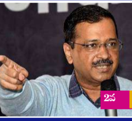
బజెపి ఆవరోషన్ కమలం విఫలం సొంత ప్రభుత్వంపై ఆస విశ్వాస తీర్మానం అసెంబ్లీలో బజెపి తీరును ఎండగట్టిన సిఎం కేజ్రీవాలర్ 2వ