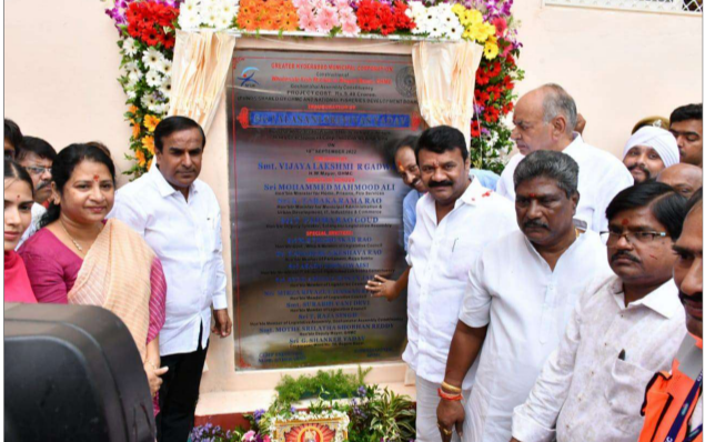
బేగంబజార్ లో ఫిష్ మార్కెట్ ప్రారంభించిన మంత్రి