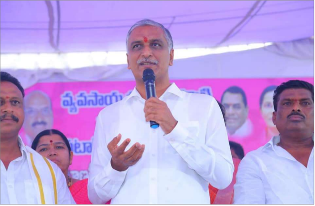
దేశంలో ఆహారభద్రతకు భరోసా ఏదీ కేంద్రం తీరుపై మండిపడ్డ హరిష్ చంద్ర

సంగారెడ్డి, సెప్టెంబర్ 10 (సమసమాజం): రైతులను కొట్టు... కార్పొరేట్లకు పెట్టు అన్నట్లుగా కేంద్రం తీరు తయారైందని మంత్రి హరిష్ చంద్ర అన్నారు. పరిశ్రమల పెంపులను అడ్డంకిస్తూ అలాంటివి నిర్ణయాలు తీసుకుంటున్నారని విమర్శించారు. దీంతో రైతుల ఇబ్బందులు ఎదుర్కొంటున్నారని ఆవేదన వ్యక్తం చేశారు.