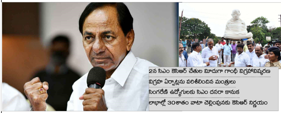
28 సిఎం కెసిఆర్ చేతుల మీదుగా గాంధీ విగ్రహావిష్కరణ విగ్రహ ఏర్పాటును పరిశీలించిన మంత్రిలు సింగరేణి ఉద్యోగులకు సిఎం దసరా కానుక లాభాల్లో 30శాతం వాటా చెల్లింపునకు కెసిఆర్ నిర్ణయం