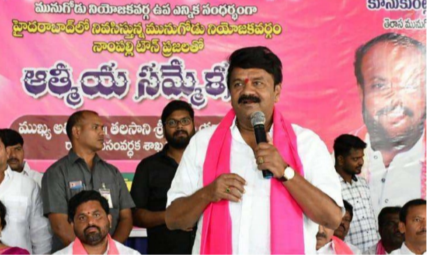
నలుగురు ఎమ్మెల్యేలను కొనబోయి దొరకారు కోట్ల రూపాయలు బజెపి ఎక్సైజివ్ తేల్చాలి మునుగోడులో టీఆర్ఎస్ ను గెలిపించాలని తలసాని పిలుపు

హైదరాబాద్, అక్టోబర్ 27 (సమ సమాజం): ప్రజలతో ఎన్నికైన ప్రభుత్వాలను కూల్చే కుట్రలతో కేంద్రంలోని బీజేపీ ప్రభుత్వం ప్రజాస్వామ్యాన్ని భ్రష్టం చేస్తున్నారని రాష్ట్ర ప్రభుత్వం పేర్కొంది.