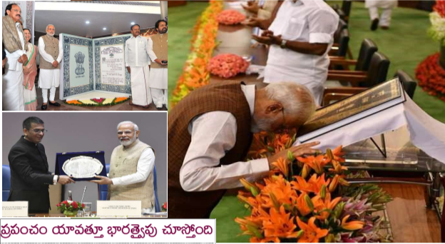
ప్రపంచం యావత్తూ భారత్యైషు మాస్రందే రాజ్యాంగం దినోత్సవే వేడుకల్లో ప్రధాని మోడీ

అమృతకాలను కరవ్య కాలంగా పేర్కొంటూ, దేశానికి స్వాతంత్ర్యం వచ్చి 75 ఏళ్లు పూర్తి చేసుకుంటున్న సందర్భంగా ఆజాద్ కా అమృతకాలలో, రాజోయే 25 ఏళ్ల అభివృద్ధి కోసం మనం ప్రయాణాన్ని ప్రారంభిస్తున్న తరుణంలో కరవ్యం అనే మంత్రాన్ని ప్రధాని నాశ్రియేష్యారు. ప్రధాన మంత్రి సరేంద్ర మోడీ శనివారం భారత అత్యున్నత న్యాయస్థానంలో రాజ్యాంగ దినోత్సవ