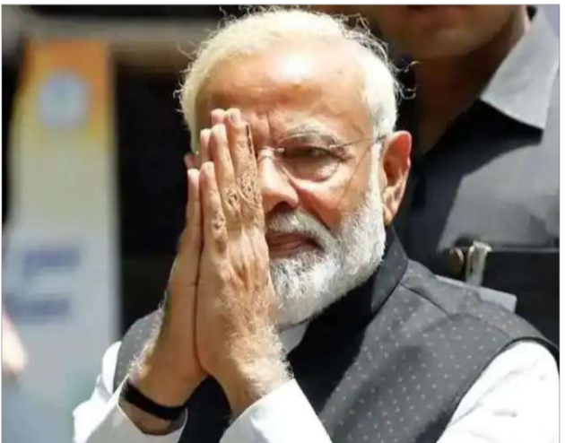
సోలంకి రికార్డును దాటిన జజిబు • 150 టీడీఎమ్ మెజారిటీ దాటగలదన్న అంచనాలు

హైదరాబాద్, డిసెంబర్ 8 (సమ సమాజం): గుజరాత్ ఎన్నికల ఫలితాల్లో 150కిపైగా స్థానాల్లో అధికార బీజేపీ అధిక్యంలో సోలంకి అతి భారీ విజయాన్ని సాధించడంలో విజయం దురుభిషేకం దాదాపు ఖరారైంది. దీంతో గుజరాత్ ఎన్నికల్లో పలు పాత రికార్డులు తుడిచిపెట్టుకుపోవడం ఖాయంగా కనిపిస్తోంది. వరుసగా 27 ఏళ్ల గుజరాత్ ను పాలిస్తున్న బీజేపీ గత ఎన్నికల్లో అత్యధికంగా 127 స్థానాలు మాత్రమే గెలవగలిగింది. 2002లో ఈ రికార్డ్ విజయాన్ని సాధించింది. ఇప్పుడు ఆ రికార్డ్ బ్రేక్ అవ్వడం ఖాయమని ట్రాంట్స్ చెబుతున్నాయి. మరోవైపు 1985లో మాధవ్ సింగ్ సోలంకి నేతృత్వంలోని కాంగ్రెస్ అత్యంత పాల్ రికార్డ్ స్థాయిలో 149 స్థానాల్లో గెలిచి