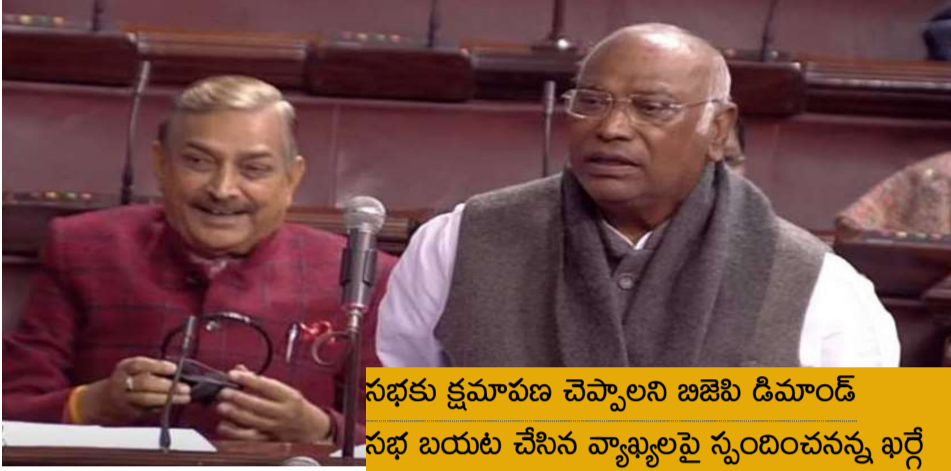
సభకు క్షమాపణ చెప్పాలని బిజెపి డిమాండ్ సభ బయట చేసిన వ్యాఖ్యలపై స్పందించనన్న ఖర్గే

హైదరాబాద్, డిసెంబర్ 20 (సమ సమాజం): ప్రగతిభవన్ లో సిఎం కేసీఆర్ తో పంజాబ్ సీఎం భగవంత్ మాన్ భట్ అయ్యారు. పలు కార్యక్రమాల కోసం మంగళవారం హైదరాబాద్ కు వచ్చిన భగవంత్ మాన్ రెండు రాష్ట్రాల పరిస్థితులు, దేశ రాజకీయాలపై ప్రగతి భవన్ లో చర్చించినట్లు సమాచారం. డీఆర్ఎస్ పార్టీ పేరును బీఆర్ఎస్ గా మార్చిన తర్వాత దేశ వ్యాప్తంగా ధాతుకుడు పెంచాలని భావిస్తున్న కేసీఆర్ పంజాబ్ ముఖ్యమంత్రితో పలు విషయాలను చర్చిస్తున్నట్లు తెలుస్తోంది. పార్టీలో ఉన్న ఎంపీలు, జాతీయ స్థాయిలో సంబంధాలను వారి సూచనల మేరకు బీజేపీకి వ్యతిరేకంగా చేపట్టాలని కార్యక్రమాలకు సన్నాహాలు చేసే అవకాశం ఉందని పార్టీ వర్గాల కథనం. భారత్ రాష్ట్ర సమితి పార్టీ కేంద్ర కార్యాలయాన్ని కేసీఆర్ డిల్లీలో ఇటీవలే ప్రారంభించిన సంగతి తెలిసిందే. నాటి నుంచి పలు రాష్ట్రాలకు చెందిన ఆయన పార్టీలకు ఆయనకు రైతు సంఘాల నేతలు 3లో