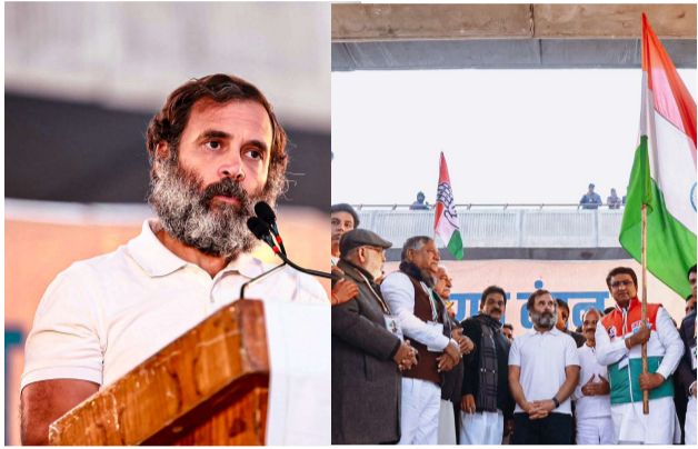
వారి కనుసన్నల్లోనే దేశ పాలన • మోడీ ప్రభుత్వంపై రాహుల్ విమర్శలు ఢిల్లీ ఎర్రకోట వద్ద కాంగ్రెస్ సభ • పాల్గొన్న నటుడు కమలహాసన్

న్యూఢిల్లీ, డిసెంబర్ 24 (సమ సమాజం): కేంద్రంలో ఉన్నది మోడీ సర్కార్ కాదని.. అది అంబానీ, ఆదానీల సర్కార్ అని కాంగ్రెస్ అగ్రనేత రాహుల్ గాంధీ అన్నారు. ఆ వ్యాపారవేత్తల జేబులోనే కేంద్ర ప్రభుత్వం ఉందని.. వారి కనుసన్నల్లోనే దేశ పాలన నడుస్తోందని మండిపడ్డారు. ఢిల్లీలోని ఎర్రకోట వద్ద కాంగ్రెస్ పార్టీ నిర్వహించిన బహిరంగ సభలో రాహుల్ మాట్లాడారు. కేంద్ర ప్రభుత్వ విధానాలపై ఆయన ఈ సందర్భంగా విరుచుకుపడ్డారు. దేశంలోని 90 శాతం మంది ప్రజలు ఏకత్వాన్ని ఇవ్వవలసిందిగా, నాకు భారత్ జోడో యాత్రలో ఇదే