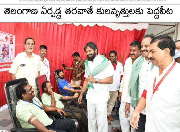
తెలంగాణ ఏర్పడ్డ తరువాత కులవృత్తులకు పెద్దపీట

గిరిజన సంఘాల ప్రగతిభవన్ ముట్టడి యత్నం హైదరాబాద్, డిసెంబర్ 30 (సమ సమాజం): సీఎం కేసీఆర్ ఇచ్చిన హామీలను వెంటనే నెరవేర్చాలంటూ ప్రగతి భవన్ ముట్టడికి గిరిజన సంఘాల నేతలు ప్రయత్నించారు. జనాభా దామాషా ప్రకారం రిజర్వేషన్లు అమలు చేయాలన్నారు. సెవలార్ జయంతిని అధికారికంగా నిర్వహించాలని, ఆ రోజున సెలవు దినంగా ప్రకటించాలని గిరిజన సంఘాలు డిమాండ్ చేశాయి. పోడు భూములకు వెంటనే పట్టాలు ఇవ్వాలని నిరూపాలు చేశారు. దీంతో అక్కడ ఉద్రిక్తత పరిస్థితులు నెలకొన్నాయి. అప్పటికే మోహరించిన పోలీసులు వారిని అడ్డుకొనేందుకు ప్రయత్నించారు. ఇరువర్గాల మధ్య తోపులాట చోటు చేసుకుంది. కొంతమంది క్యాంపు కార్యాలయంలోకి వెళ్లేందుకు ప్రయత్నించారు. వారిని నిలువరించి.. పోలీసు వ్యాన్ లలో ఎక్కించారు. పోలీసులకు వ్యతిరేకంగా నిరూపాలు చేశారు. అదుపులోకి తీసుకున్న గిరిజన సంఘాల నేతలను పీఎస్ లకు తరలించారు.