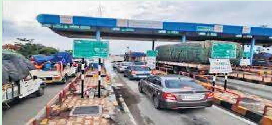
హైదరాబాద్, జనవరి 12 (సమసమాజం): గతంతో పోలిస్తే సరిపడా బస్సులను ఆర్టీసీ సంక్రాంతి సెలవులలో తీసుకుని వచ్చింది. అయినా వెళ్లాలనుకున్న వారికి పడిగాపులు తప్పడం లేదు. వివిధ రూట్లలో బస్సులు సరిపోక ప్రయాణికులు బస్టాండ్లలో విజృంభణలతో ఎదురు చూస్తున్నారు.

తమ కుటుంబ సభ్యులతో కలిసి వుట్టిన ఊళ్లలో ఈ సంక్రాంతి సెలవుల్లో సరిపడా గడిపేందుకు సిద్ధమయ్యారు. దీంతో ఆర్టీసీ బస్సులు జనంతో కిటకిటలాడుతోంది. బస్సుల్లో ఖాళీ లేక ప్రయాణికులు వేరే బస్సుల కోసం బస్టాండ్ వేచి ఉంటున్నారు. ఆర్టీసీ సంస్థ కూడా పండుగను దృష్టిలో ఉంచుకొని హైదరాబాద్ ఇతర ప్రాంతాలకు ప్రత్యేక బస్సులను ఏర్పాటు చేసింది. ఉన్న బస్సులను ప్రత్యేక డ్రైవులుగా నడుపుతున్నామని ఆర్టీసీ అధికారులు చెప్పారు. ఇకపోతే సంక్రాంతి పండుగ సందర్భంగా హైదరాబాద్ నగరవాసులు గ్రామాల బాట వట్టారు. సంక్రాంతిని సాంతాక్షలో జరుపుకునేందుకు సొంతవాసాల్లో బయలుదేరారు. నూజ్లకు సెలవులు ప్రకటించడంతో అంతా గ్రామాల బాట వట్టారు. దీంతో హైదరాబాద్-విజయవాడ జాతీయ హైవేపై వాహనాల రద్దీ పెరిగింది. విజయవాడ వైపు వెళ్లే వాహనాల కారణంగా వతంగి టోల్గేట్ వద్ద రద్దీ నెల కొంది. సంక్రాంతి సెలవులు రావడంతో ఊళ్లకు వెళ్లే వారిలో వాహనాల రద్దీ పెరిగింది.