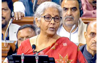
పెట్టారు. చలురాష్ట్రాల ఎన్నికలను దృష్టి పెట్టుకుని ఉత్సాహకరంగా ఉంటుందన్న భావన లేకుండా ముందుకు సాగారు. అమె బడ్జెట్ ప్రసంగం గంటన్నర సేపు సాగింది. ఇకపోతే ఏడు ప్రాధాన్యతా అంశాల ఆధారంగా బడ్జెట్ 2వ పేజీలో...