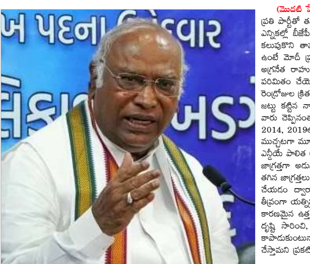
(మొదటి పేజీ తరువాయి) రాజ్యాంగం అనేది ఉండవని అన్నారు. ప్రతి పార్టీలో తమ అభిప్రాయాలను పంచుకుంటామని తెలిపారు. వచ్చే ఎన్నికల్లో బీజేపీకి మెజారిటీ రాదని జోష్యం చెప్పారు. అన్ని పార్టీలను కలుపుకొని తాము మెజారిటీ సాధిస్తామన్నారు. ప్రతిపక్షాలు బలంగా ఉంటే మోడీ ప్రభుత్వాన్ని వంద శాతం ఓడించవచ్చని కాంగ్రెస్ పార్టీ అగ్రనేత రాహుల్ గాంధీ అన్నారు. మరోవైపు బీజేపీని వంద సీట్లకు పరిమితం చేయొచ్చని బీహార్ సీఎం, జేడీయూ అధినేత నితీష్ కుమార్ రెండోజోషా క్రితమే చెప్పారు. కాంగ్రెస్ పార్టీ నాయకులతో పాటు వారితో జట్టు కట్టిన నాయకులు ఎలాంటి ప్రకటనలు చేసినా వాస్తవ దృష్టి వారు చెప్పినంత సులభంగా ఏమీ లేదు. నరేంద్ర మోడీ నేతృత్వంలో 2014, 2019లో రెండు సార్లు సాతతంగా అధికారంలోకి వచ్చిన బీజేపీ ముప్పుగా మారేసరికి వచ్చేందుకు అన్ని వ్యూహాలు రచిస్తోంది. బీజేపీ, ఎన్డీయే పాలిత రాష్ట్రాల్లో తిరిగి అధికారంలోకి వచ్చేలా చూసుకోవడంపై జాగ్రత్తగా అడుగులు వేస్తున్నారు. ప్రజావ్యతిరేకతకు కొట్టుకుపోకుండా తగిన జాగ్రత్తలు తీసుకుంటున్నారు. కేంద్ర ప్రభుత్వ పథకాలను ప్రచారం చేయడం ద్వారా రాష్ట్రాల్లో ప్రయోజనం పొందాలని బీజేపీ శ్రేణులు తీవ్రంగా యత్నిస్తున్నాయి. బీజేపీ రెండుసార్లు అధికారంలోకి రావడానికి కారణమైన ఉత్తరప్రదేశ్ లో సీఎం యోగి ఆదిత్యనాథ్ శాంతి భీష్మతలపై దృష్టి సారించి, గ్యాంగ్ నేతలకు గుజారంలో నేర్పూటా ఓటు బ్యాంకీస్ ను కాపాడుకుంటున్నారు. 2024 జనవరి లోపు రామమందిరం పూర్తి చేస్తామని ప్రకటించి పనులు ఉధృతం చేశారు.