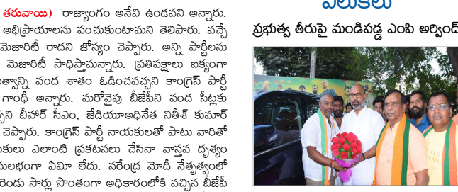
నిజామాబాద్, ఫిబ్రవరి 22 (సమ సమాజం): రాష్ట్ర ప్రభుత్వ నిర్వహించే ప్రజల ప్రాణాలకు రక్షణ లేకుండా పోయిందని బీజేపీ ఎంపీ అర్జున్ అరోపించారు. కాలనీల్లో కుక్కలు, ఆస్పత్రుల్లో ఎలుకలు స్త్రీల విహారం చేస్తున్నాయని విమర్శించారు. మరోవైపు హాస్పిటల్ విద్యార్థులకు పురుగుల ఆస్పం పెడుతున్నారని అన్నారు. మైనార్టీ ప్రాంతాల్లో పర్యటించి ప్రజల సమస్యలు తెలుసుకుంటామని ఆయన చెప్పారు. శ్రీరాంసాగర్, నిజాంసాగర్ ప్రాజెక్టు గేట్ల సరైన నిర్వహణ లేక శిథిలావస్థకు చేరాయని అర్జున్ అన్నారు. తెలంగాణలో బీజేపీ అధికారంలోకి రాగానే పనులు పరిశ్రమలు ఏర్పాటు చేస్తామని ఎంపీ అర్జున్ చెప్పారు. కొన్ని దేశాలు దిగుమతులు నిలిపివేయడం వల్లనే పనులు ధర పడిపోయిందని ఆయన స్పష్టం చేశారు. రైతులు పండించిన పంటలకు ధరలు తగ్గినప్పుడు.. రాష్ట్ర ప్రభుత్వం ఎంఎస్ పి పథకం అమలు చేయాలన్నారు. బీజేపీ అధికారంలోకి వస్తే ఇప్పుడున్న అన్ని పథకాలు యధావిధిగా కొనసాగిస్తూ.. కొత్త పథకాలు అమలు చేస్తామని ఎంపీ అర్జున్ హామీ ఇచ్చారు.