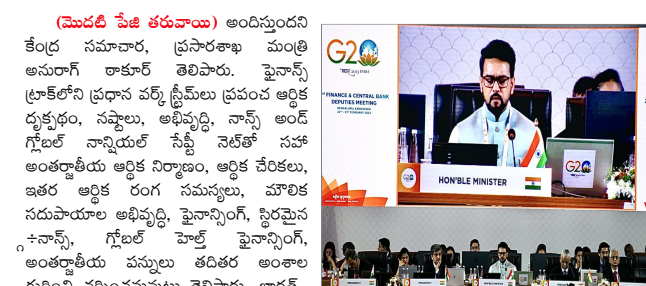
(మొదటి పేజీ తరువాయి) అందిస్తుందని కేంద్ర సమాచార, ప్రసారశాఖ మంత్రి అనూరాగ్ ఠాకూర్ తెలిపారు. పైనాన్స్ ట్రాక్ లోని ప్రధాన వర్క్ స్ట్రీమ్ లు ప్రపంచ ఆర్థిక దృక్పథం, నష్టాలు, అభివృద్ధి, వ్యాన్స్ అండ్ గ్లోబల్ నాన్ యుల్ స్ట్రీమ్ నెట్ వర్క్ సహా అంతర్జాతీయ ఆర్థిక నిర్మాణం, ఆర్థిక చేరికలు, ఇతర ఆర్థిక రంగ సమస్యలు, మౌలిక సదుపాయాల అభివృద్ధి, పైనాన్సింగ్, స్థిరమైన ినాన్స్, గ్లోబల్ హెల్త్ పైనాన్సింగ్, అంతర్జాతీయ పన్నులు తదితర అంశాల గురించి చర్చించనున్నట్లు తెలిపారు. భారత్.. జీ-20 ఆధ్వర్య దేశంగా బాధ్యతలు చేపట్టిన నాటి నుంచి సన్మాహక సదస్సులుతోపాటు, పలు కార్యక్రమాలను చేపడుతోంది. బెంగళూరులో సమావేశాన్ని కేంద్ర సమాచార, ప్రసారశాఖ మంత్రి అనూరాగ్ ఠాకూర్ ప్రారంభించారు. ప్రారంభ సెషన్ లో అనూరాగ్ ఠాకూర్ ప్రసంగిస్తూ.. ప్రపంచంలోనే కీలక దేశాల ఆధ్వర్యలు, ప్రధానమంత్రులు, ప్రతినిధులు పాల్గొనే జీ20 సదస్సును విజయవంతం చేసేందుకు భారత ప్రభుత్వం దేశంలోని ప్రధాన నగరాలు, పట్టణాల్లో సన్మాహక సదస్సులు