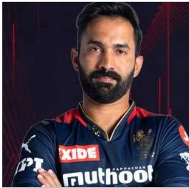
కెవల్ ఫామ్‌పై దినేశ్ కార్తీక్

ముంబై, ఫిబ్రవరి 22 (సమ సమాజం): డీమిండియా స్టార్ బ్యాటర్ కేవల్ రాహుల్ ఫామ్ గురించి ఇప్పుడు చర్చ నడుస్తోంది. గత కొంత కాలంగా అన్ని ఫార్మాట్లలో పరుగులు రాబట్టడానికి ఇబ్బంది పడుతున్నాడు. ఈ క్రమంలో జట్టులోనుంచి రాహుల్ ని తొలగించాలని డీమాండ్లు వినిపిస్తున్నాయి. అతని ఫామ్ పై అభిమానులు, సినీయర్ క్రికెటర్లు విమర్శలు గుప్పిస్తున్నారు. ఈ విషయంలో రాహుల్ భవిష్యత్తుపై దినేశ్ కార్తీక్ కీలక వ్యాఖ్యలు చేశారు. 'రాహుల్ ని పక్కన పెట్టే బ్రెండ్ వచ్చింది. గత మ్యాచుల ప్రదర్శన చాలా చెత్తగా ఉంది. ఇన్ని మ్యాచులు ఫేయిల్ అవుతున్నా ఛాన్స్ లు ఎందుకిస్తున్నారో అర్థం కావటంలేదు. రాహుల్ గొప్ప బ్యాటర్. కాదనను. కానీ, ప్రస్తుత పరిస్థితినిబట్టి ఫామ్ లో ఉన్న వాళ్లను పక్కన పెట్టడం కరెక్ట్ కాదు. కొంత టైం తీసుకొని మళ్లీ తిరిగి ఫ్రెష్ గా తిరిగి రావాలని కార్తీక్ అన్నారు. కేవల్ రాహుల్ గత 47 ఇన్నింగ్స్‌లో 26.15 సగటుతో 1203 పరుగుల మాత్రమే చేశారు. ఇందులో మూడు సెంచురీలు, 3 హాఫ్ సెంచురీలు ఉండగా.. ఐదు సార్లు డకౌటుయ్యారు. రాహుల్ టెస్ట్ కెరీర్‌లో 17 సార్లు సింగిల్ డిజిట్‌తో బయటయ్యారు. 2022 జనవరి నుంచి టెస్టులో ఒక్క ఇన్నింగ్స్‌లో కూడా 25 స్కోరు సమాధు చేయలేక పోయాడు.