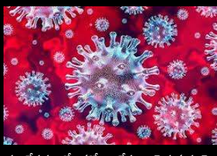
ఈ నేపథ్యంలో కరోనా కేసుల పెరుగుదలపై మార్చి 30వ తేదీన గురువారం ఢిల్లీ ప్రభుత్వ అత్యవసర సమావేశం ఏర్పాటు చేయనుంది.

ఢిల్లీలో ఆందోళనకర స్థాయిలో కేసుల సంఖ్య మూఢిల్లీ,మార్చి30(సమసమాజం): కరోనా మహమ్మారి మళ్లీ విజృంభిస్తోంది. ఇప్పటికే దేశంలోని పలు రాష్ట్రాల్లో కరోనా కేసులు భారీగా సమోదవుతున్నాయి. గత కొద్ది రోజులుగా దేశ రాజధాని ఢిల్లీలో ఆందోళనకర స్థాయిలో కరోనా కేసులు పెరుగుతున్నాయి. బుధవారం రికార్డ్ స్థాయిలో ఒక్కరోజులో 300 కరోనా కేసులు నమోదయ్యాయి. గత 6 నెలల తర్వాత మొదటి సారి రోజువారీ కరోనా కేసులు 300 దాటాయి.