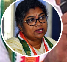
సమ సమాజం ప్రత్యేక కథనం