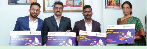
విద్యార్థులకు సూచించిన సబిత