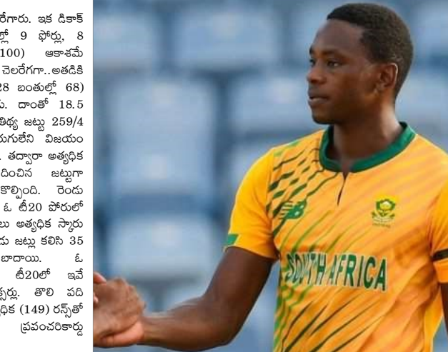
517 పరుగులు అత్యధిక స్కోరు చేశారు. రెండు జట్టు కలిపి 517 పరుగులు అత్యధిక స్కోరు చేశారు. రెండు జట్టు కలిపి 517

సెంచూరియన్, మార్చి 27 (సాటోలో) చెలరేగారు. ఇక డికాక్ ముసమాజం): పరుగులు జడివా న.. కాదు.. కాదు.. సునామీ. ఫలితంగా రికార్డులు వెల్లు వెళ్తాయి. దక్షిణాఫ్రికా-వెస్టైండీస్ మధ్య ఆదివారం జరిగిన రెండో టీ20 ఇందుకు వేదికైంది. గెలుపు ఎవరిదన్నద ఇవకప్పు పెడితే ఇరు జట్టు కలసి పరుగులు అందుకుంది. తద్వారా అత్యధిక పారించాయి. 258 రన్స్ చేసి గెలుపు ధీమాలో ఉన్న రికార్డు నెలకొల్పింది. రెండు కరీబియన్లకు సౌతాఫ్రికా ఓపెన్ రికార్డు సూపర్ సెంచరీతో 517 పరుగులు అత్యధిక స్కోరు చేశారు. రెండు జట్టు కలిపి 517 వెస్టైండీస్ 258/5 స్కోరు చేసింది. జాన్స్ చా++లక్కన్ (46 బంతుల్లో 10 ఫోర్లు, 11 సిక్సర్లతో 118) మెరుపు సెంచరీ కొట్టారు. క్రెల్ మేయర్స్ (27 బంతుల్లో 51), షెషర్డ్ (41