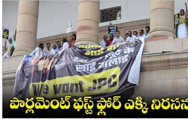
పార్లమెంట్ ఫస్ట్ ఫ్లోర్ ఎక్కి నిరసన

(మొదటి పేజీ తరువాయి) నినాదాలు చేశారు. తృణముల్ ఎంపీలు కూడా ప్రత్యేక ఆందోళనలు చేపట్టారు. అదానీ అంశంపై మోడీ హాసం వీధుల దివ్యాండ్ చేశారు. అదానీపై విచారణ చేపట్టాలన్న డిమాండ్ అయినా అయినా సహకరిస్తుందని ఆరోపించారు. తృణముల్ కాంగ్రెస్ పార్టీలో పాటు.. కాంగ్రెస్, డిఎంకే, ఆర్జేడీ, సీపీఐ, సీపీఎం, ఎస్పీ, శివసేన, ఎంపీఎంకే పార్టీలన్నీ కలిసి ప్రతిష్ట నేత మల్లిఖార్జున్ ఖర్జేతో భేటీ అయ్యారు. ఈ క్రమంలో పార్లమెంట్ లో రథం కొనసాగుతూనే ఉన్నది. రోజు విదత సమావేశాలు ప్రారంభమై దాదాపు 10 రోజులు కాస్తున్నా ఉభయసభల్లో వాయిదా వరకు మాత్రం ఆగడంలేదు. అదానీ-హిందెన్ బెర్ల వ్యవహారంపై జాయింట్ పార్లమెంటరీ కమిటీ వేయానని విపక్షాలు పట్టుపడుతుండగా.. లండన్ లోని కేంబ్రిడ్జ్ లో యూనివర్సిటీలో చేసిన ప్రసంగంపై అదానీ క్షమాపణలు చెప్పాలని ఆధికారపక్ష సభ్యులు ఎదురుదాడి చేస్తున్నారు.