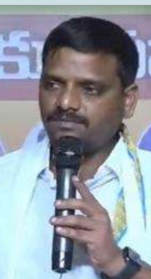
కార్యాలయంపై దాడి జరిగిన.. వార్తలు ఆగలేదన్నారు.