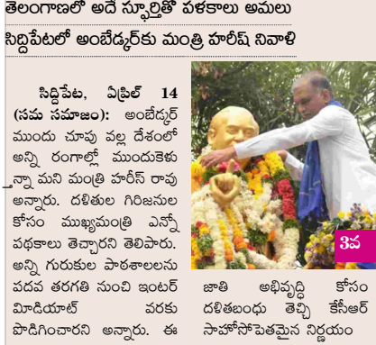
తెలంగాణలో అదే స్ఫూర్తితో పోరాటాలు అమలు నిర్మిపేటలో అంబేద్కర్ కు మంత్రి హరీష్ నివాళి