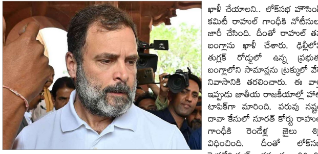
న్యూఢిల్లీ, ఏప్రిల్ 14 (సమ సమాజం): రాహుల్ గాంధీపై అనర్హత వేటు పడింది. కాంగ్రెస్ పార్టీ ముఖ్యనేత రాహుల్ గాంధీ కీలక నిర్ణయం తీసుకున్నారు. తనపై పడిన అనర్హత వేటు కారణంగా.. ఢిల్లీలోని ప్రభుత్వ బంగ్లాను శుక్రవారం ఖాళీ చేశారు. ఏప్రిల్ 22లోగా బంగ్లాను రాహుల్ గాంధీపై అనర్హత వేటు పడింది. అయితే.. రెండేళ్ల జైలు శిక్ష తీర్పును నిలిపేయాలని కోరతూ.. దాఖలైన పిటిషన్ పై సూరత్ కోర్టు ఏప్రిల్ 20న విచారణ చేపట్టుతుంది. 3వ పేజీలో...