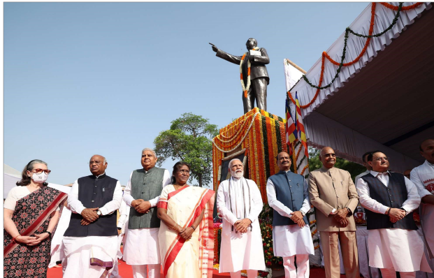
న్యూఢిల్లీ, ఏప్రిల్ 14 (సమ సమాజం): విగ్రహం వద్ద రాష్ట్రపతి ద్రౌపది ముర్ము, ప్రధాని రాజ్యాంగ నిర్మాత దాక్టర్ బాబాసాహెబ్ డా. నోనియాగాంధీ తదితరులు నివాళి అర్పించారు. అంబేద్కర్ సేవలను గుర్తు దేశానికే ఆయనకు ఘనంగా నివాళి చేసుకున్నారు. అన్ని రాష్ట్రాల్లోనూ జయంతి అర్పించారు. పార్లమెంట్ చౌకలో అంబేద్కర్ వేడుకలు ఘనంగా నిర్వహించారు.