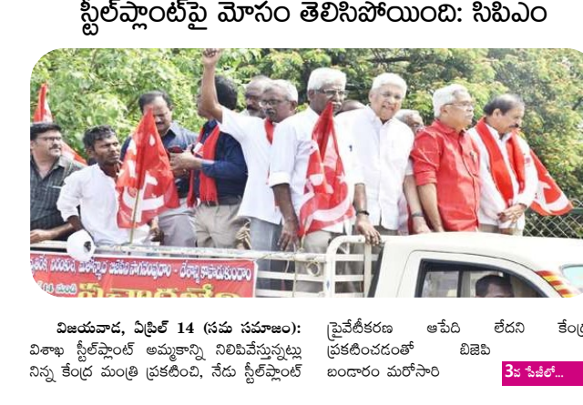
స్ట్రీట్ షాంట్ పై మోసం తెలిసిపోయింది: సిపిఎం విజయవాడ, ఏప్రిల్ 14 (సమ సమాజం): విశాఖ స్ట్రీట్ షాంట్ అమ్మకాన్ని నిలిపివేస్తున్నట్లు నిన్ను కేంద్ర మంత్రి ప్రకటించి, నేడు స్ట్రీట్ షాంట్ ప్రకటించడంతో బిజెపి బండారం మరోసారి 3వ పేజీలో...