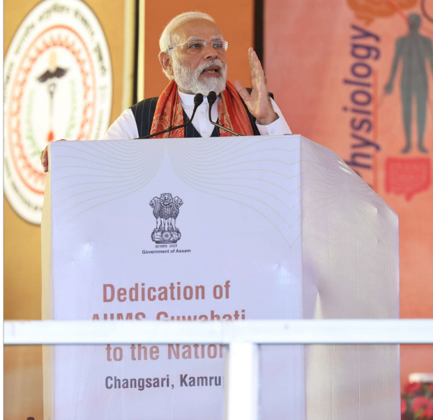
న్యూఢిల్లీ, ఏప్రిల్ 14 (సమ సమాజం): కేశాన్య రాష్ట్రాలకు గత ప్రభుత్వాలు చాలా దూరంగా ఉండేవని, వాటిని దగ్గరకు చేర్చేందుకు బీజేపీ ప్రభుత్వం అంకితభావంతో కృషి చేస్తోందని ప్రధాన మంత్రి నరేంద్ర మోడీ చెప్పారు. ఆయన శుక్రవారం అస్సాంలో బీహూ ఉత్సవాల్లో పాల్గొనడంతోపాటు గువాహాటిలో ఆఖిల భారత వైద్య విజ్ఞాన శాస్త్రాల సంస్థ ఎయిమ్స్ ను ప్రారంభించారు. ఈ సందర్భంగా ఆయన రూ.14,300 కోట్ల విలువైన వివిధ ప్రాజెక్టులకు శంకుస్థాపన, ప్రారంభోత్సవాలు చేశారు. గువాహాటి బీహూరంగ సభలో మోడీ మాట్లాడుతూ, రొంగలి బీహూ పండుగ సందర్భంగా ప్రజలకు శుభాకాంక్షలు తెలిపారు. 3వ పేజీలో...

గతంలో ఈశాన్య రాష్ట్రాలను దూరంగా పెట్టేవారు జరిపి ప్రభుత్వం అంకితభావంతో అభివృద్ధి కృషి