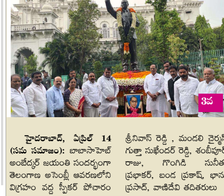
అసెంబ్లీ ఆవరణలోని విగ్రహం వద్ద స్పీకర్ పోచారం నివాళి