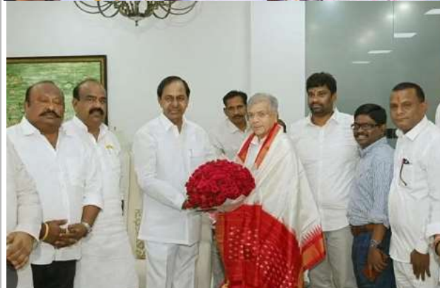
ప్రగతిభవన్ లో కేసీఆర్ తో ప్రకాశ్ అంబేద్కర్ భేటీ శాలువా కప్పి సన్నిచిన సిఎం