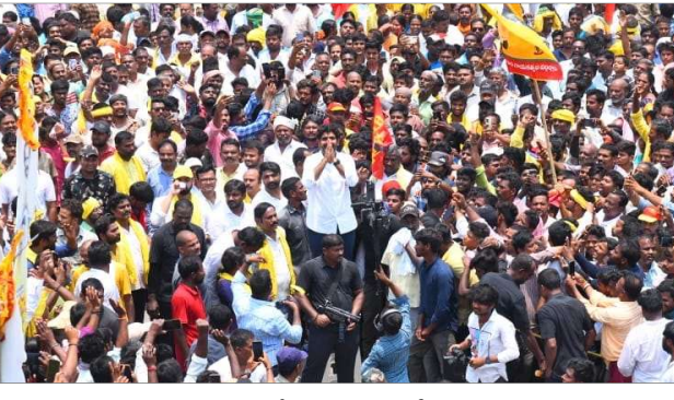
అధికారంలోకి రాగానే జివో ఎత్తిస్తాం యువగళం పాదయాత్రలో లోకేష్ హామీ

రాష్ట్ర ప్రభుత్వానికి కృతజ్ఞత తెలియజేస్తూ మే 13 న దళిత, గిరిజన సంఘాల ఆధ్వర్యంలో అభినందన సభను నిర్వహిస్తున్నట్లు రాష్ట్ర ఎన్నికల కమిషన్ ఛీఫ్ రెడ్డి వెల్లడించారు.