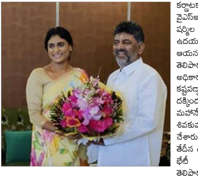
బెంగళూరు, మే 29 (సమ సమాజం): తరతర ఆమె శుభాకాంక్షలు తెలిపారు.

కర్నాటక డిప్యూటీ సీఎం డి.కె. శివకుమార్ తో వైఎస్ఆర్ తెలంగాణ పార్టీ అధ్యక్షురాలు షర్మిల భేటీ అయ్యారు. సోమవారం ఉదయం బెంగళూరులోని డి.కె. నివాసంలో ఆయనతో భేటీ అయ్యి.. శుభాకాంక్షలు తెలిపారు. కర్నాటకలో కాంగ్రెస్ పార్టీని అధికారంలో తీసుకురావడానికి చాలా కష్టమన్నారు.. కష్టానికి తగిన ప్రతిఫలం దక్కిందంటూ డి.కె.కి కిషోరినిచ్చారు. మహానేత వైఎస్ఆర్ ఉన్న సాన్నిహిత్యాన్ని డి.కె.కి శివకుమార్.. వైఎస్ షర్మిల వద్ద గుర్తు చేశారు. మరోవైపు.. వైఎస్ షర్మిల మే 15వ తేదీన డి.కె.కి శివకుమార్ బర్త్ డే రోజు కూడా భేటీ అయ్యి.. శుభాకాంక్షలు తెలిపారు. మరోసారి అధికారం చేపట్టిన