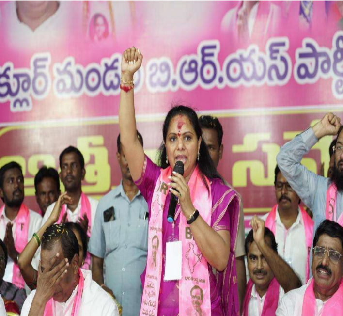
మక్లూరు మండల బి.ఆర్.ఎస్ పార్టీ సమ్మేళనంలో కవిత పాల్గొన్నారు.

నిజామాబాద్, మే 30 (సమ సమాజం): గత 22 ఏళ్లుగా ప్రజల కోసమే బిఆర్ఎస్ పనిచేస్తోందని ఎమ్మెల్యే కల్వకుంట్ల కవిత అన్నారు. అనేక మంది కార్యకర్తల పార్టీ కోసం జీవితాలను త్యాగం చేశారని కొనియాడారు. మక్లూరు నిర్వహించిన బిఆర్ఎస్ ఆత్మీయ సమ్మేళనంలో మంత్రి మల్లారెడ్డితో కలిసి కవిత పాల్గొన్నారు. ఒకప్పుడు గులాబీ కండువా కప్పుకుంటే ఎగతాళి చేసేవారని. కానీ, ఇప్పుడు గులాబీ కప్పుకున్నందుకు కార్యకర్తల గర్వపడుతున్నారన్నారు. కార్యకర్తల ఆగ్రహమే కాకేవరం జలాలు అని కవిత పేర్కొన్నారు. తెలంగాణ ప్రజల సంక్షేమం వీఆర్ఎస్ కార్యకర్తల లక్ష్యం, కర్తవ్యం అని కవిత స్పష్టం చేశారు. దేశంలో ఇప్పటి వరకు