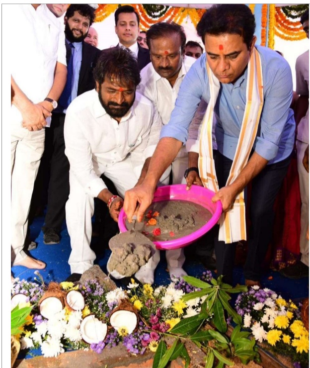
ఇమ్మడు మాత్రం పచ్చని పంటలతో ఇరిగేషన్