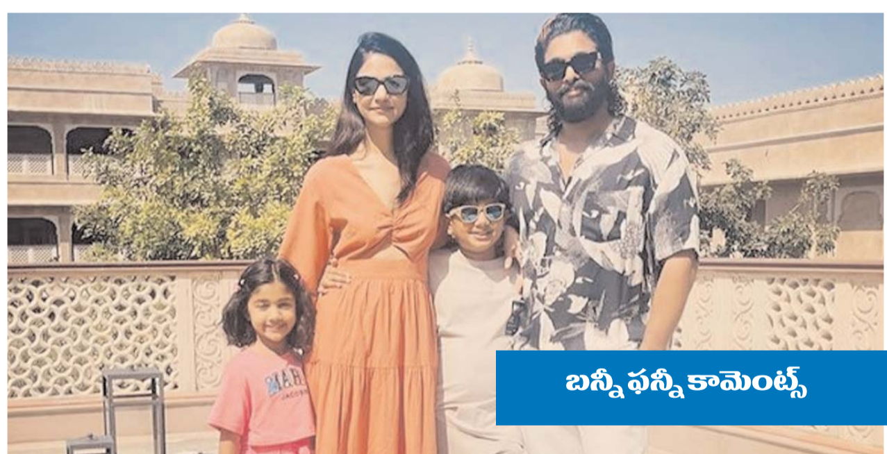
బన్నీ ఫన్నీ కామెంట్స్