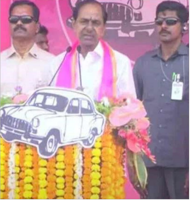
కేసీఆర్ స్పష్టం చేశారు. బీఆర్ఎస్ పట్టిందే తెలంగాణ ప్రజల హక్కులు, నీళ్లు, నిధుల కోసం. కాంగ్రెస్ పార్టీ 50 ఏండ్లు అధికారంలో ఉంది. తెలంగాణ మనది మనకు మరీ పడేండ్ల బీఆర్ఎస్ పాలనలో, 50 ఏండ్ల ఉండే. మంచి పంటలతోని, 4వ పేజీలో..