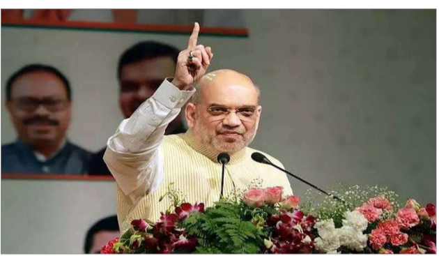
బజ్జెటితోనే తెలంగాణ రాష్ట్ర అభివృద్ధి సాధ్యం ఎన్నికల హామీలు అమలు చేయడంలో కెసిఆర్ విఫలం : అమిత్ షా

గద్వాల, నవంబర్ 18 (సమ సమాజం): ఈ సందర్భంగా అమిత్ షా జోగులాంబ శక్తి పీఠం కోసం మోడీ సర్కార్ మాట్లాడుతూ.. "కేసిఆర్ ఇప్పటి వరకూ ఏవి నెరవేర్చలేదు. గుర్రం గడ్డ వంటన, గట్టులిష్ట, ఖర్చు చేయలేదని కేంద్ర హోంమంత్రి అమిత్ షా పాలమూరు రంగారెడ్డి ప్రాజెక్టు పూర్తి చేయలేదు. వాటికి బోయలను ఎస్టీ జాబితాలో 3వ పేజీలో..