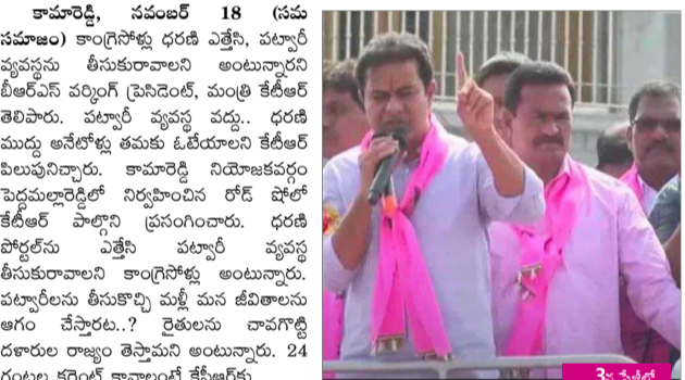
కామారెడ్డి, నవంబర్ 18 (సమ సమాజం): కాంగ్రెస్లో ధరణి ఎత్తేసి, పట్నారీ వ్యవస్థను తీసుకురావాలని అంటున్నారని టీఆర్ఎస్ పార్టీని పార్టీని పైకి తెచ్చింది. మంత్రి కేటీఆర్ తెలిపారు. పట్నారీ వ్యవస్థ వద్దు. ధరణి ముద్దు అనేటోళ్ళు తమకు ఓటేయాలని కేటీఆర్ పిలుపునిచ్చారు. కామారెడ్డి నియోజకవర్గం పెద్దపల్లారెడ్డిలో నిర్వహించిన రోడ్ షోలో కేటీఆర్ పాల్గొని ప్రసంగించారు. ధరణి పోర్టల్ను ఎత్తేసి పట్నారీ వ్యవస్థ తీసుకురావాలని కాంగ్రెస్లో అంటున్నారు. పట్నారీలను తీసుకొచ్చి మళ్ళీ మన జీవితాలను అగం చేస్తారట..? రైతులను చావగొట్టి దళారుల రాజ్యం తెస్తామని అంటున్నారు. 24 గంటల కరెంట్ కావాలంటే కేసిఆర్కు 3వ పేజీలో..

ధరణి ఎత్తేస్తే మళ్ళీ రైతులు గోస పడతారు : మంత్రి కేటీఆర్