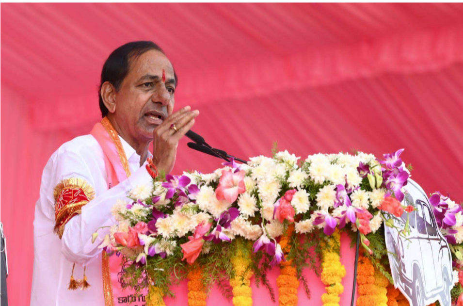
నల్గొండ వాడితే మంచి భవిష్యత్ ఉంటుంది ♦ దేవరకర్త ప్రజా ఆశీర్వాద సభలో కేసీఆర్

ఓటర్లు పరిణితితో ఓటిస్తే ప్రజాస్వామ్యం గెలుస్తుంది