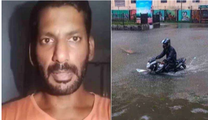
భావిస్తున్నా ముఖ్యంగా వర్షం కారణంగా పాకే డ్రైనేజీ నీరు మిశ్రమంలోకి రావడం కంటే ఎక్కువగా మిశ్రమంలోకి రావడం కంటే, అవకాశం, మంచి నీరు అందుకోవడం భావిస్తున్నా. అయితే, ఇదే సందర్భంలో మిశ్రమం మిశ్రమం సురక్షితంగా లేం. మీరు చేపట్టిన

చెన్నై, డిసెంబర్ 5 (సమ సమాజం): మిగిలిన తుఫాన్ తాకిడికి తప్పకుండా రాజధాని చెన్నై అతలాకుతలమైంది. భీకర గాలులు, కుండపోత వానలతో చెన్నై నగర పలు జిల్లాల్లో అనేక ప్రాంతాలు నీట మునిగిపోయాయి. సోమవారం సగం కురిసిన భారీ వర్షం దానికి జనతీవనం అప్రవృత్తమైంది. రోడ్లపైకి వరదనీరు రావడంతో కార్లు, ఇతర వాహనాలు కొట్టుకుపోయాయి. తుఫాన్ ప్రభావంతో చెన్నై పానులు తీవ్ర అవస్థలు పడుతున్నాయి. కరెంటు, ఆహారం, నీరు లేక తిప్పలు పడుతున్నాయి. నగరంలో నెలకొన్న పరిస్థితులపై ప్రముఖ సిని నటుడు విశాల్ స్పందించారు. 2015లో వచ్చిన వర్షానికి నగరం పూర్తిగా ప్రతిబింబించిందని గుర్తు చేశారు. అది జరిగి ఏళ్లు గడుస్తున్నా నగర పరిస్థితులే ఎలాంటి మార్పు లేకపోగా.. మరింత అధునంగా తయారైందంటూ తీవ్ర అసహనం వ్యక్తం చేశారు. 'డియర్ ట్రయి రాజన్ (చెన్నై మేయర్), గ్రేటర్ చెన్నై కార్పొరేషన్ కమిషనర్, ఇతర అధికారులకు.. మీరంతా మీ కుటుంబ సభ్యులతో కలిసి సురక్షితంగా ఉన్నారని