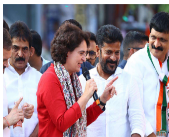
రాజకీయాల్లో అనుభూతిగా ఎదిగిన నేత కాంగ్రెస్ లో చేరి అనేక కాలంలోనే పిపిసి డిప్యూటీ సీనియర్ ప్రభుత్వాన్ని ఎండగట్టడంతో ప్రజాదరణ

టీడీపీ తరపున మరోసారి బరిలోకి దిగి ఆయన ఘన విజయం సాధించారు. ఆ ఎన్నికల్లో డి.వి.ఎస్.ఎస్. అధికారం చేపట్టింది. అప్పటి నుంచి అధికార పార్టీకి వ్యతిరేకంగా పోరాడుతూ ఉండేవారు. 2014 - 2017 మధ్య డి.వి.ఎస్.ఎస్. పార్టీ లీడర్ గా ఉన్నారు. 2017 అక్టోబర్ లో తెలుగుదేశం పార్టీకి రాజీనామా చేసి, కాంగ్రెస్ పార్టీలో చేరారు. 3 ఏళ్ల అసెంబ్లీకాలంలోనే ఎన్నోసార్లు చోదాతో కాంగ్రెస్ అధికారం అయిన కీలక బాధ్యతలు అప్పగించింది. 2018లో డి.వి.ఎస్.ఎస్. పార్టీని ప్రెసిడెంట్ గా నియమించారు. అనంతరం 2018 అసెంబ్లీ ఎన్నికల్లో కొడంగల్ నుంచి పోటీ చేసి ఓడిపోయారు. 2019 మే లో జరిగిన లోక్ సభ ఎన్నికల్లో కాంగ్రెస్ తరపున మల్కాజగిరి పార్లమెంట్ నియోజకవర్గం నుంచి పోటీ చేసి ఎంపీగా గెలిచారు. అనంతరం రేవంత్ రెడ్డిని తెలంగాణ రాష్ట్ర అధ్యక్షుడిగా జూన్ 26, 2021లో కాంగ్రెస్ పార్టీ నియమించింది. 2021 జూలై 7న అప్పటి తెలంగాణ రాష్ట్ర కాంగ్రెస్ వ్యవహారాల ఇంచార్జ్ మాజీ కమిషనరీ సమకర్త డి.వి.ఎస్.ఎస్. ప్రమాణిజు సాగం చేశారు. అప్పటి నుంచి కేసీఆర్ పాలనపై వ్యతిరేకంగా పోరాడుతూనే ఉన్నారు. ఆయన్ను ఓడించడం కోసం తెలంగాణ అసెంబ్లీ ఎన్నికల్లో సర్వత్రా అధికారం రాగూర్చి మేధానిని నామినేట్ చేసి ఎమ్మెల్యే స్టీఫెన్ సెన్ కు లంచం ఇవ్వజూపిన కేసులో మే 31 2015న, రేవంత్ రెడ్డిపై స్టింగ్ ఆఫ్ డి.వి.ఎస్.ఎస్. నిరీడక శాఖ (ఎన్.డి) ఆర్డర్ చేసింది. అప్పటి నుంచి రేవంత్ రెడ్డిపై స్టింగ్ ఆఫ్ డి.వి.ఎస్.ఎస్. నిరీడక శాఖ (ఎన్.డి) ఆర్డర్ చేసింది. అప్పటి నుంచి రేవంత్ రెడ్డిపై స్టింగ్ ఆఫ్ డి.వి.ఎస్.ఎస్. నిరీడక శాఖ (ఎన్.డి) ఆర్డర్ చేసింది. అప్పటి నుంచి రేవంత్ రెడ్డిపై స్టింగ్ ఆఫ్ డి.వి.ఎస్.ఎస్. నిరీడక శాఖ (ఎన్.డి) ఆర్డర్ చేసింది.