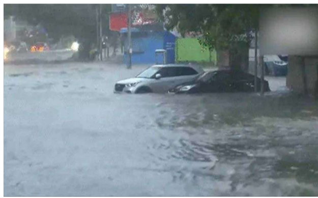
వరంగల్, ఖమ్మం జిల్లాల్లో వర్షాలు