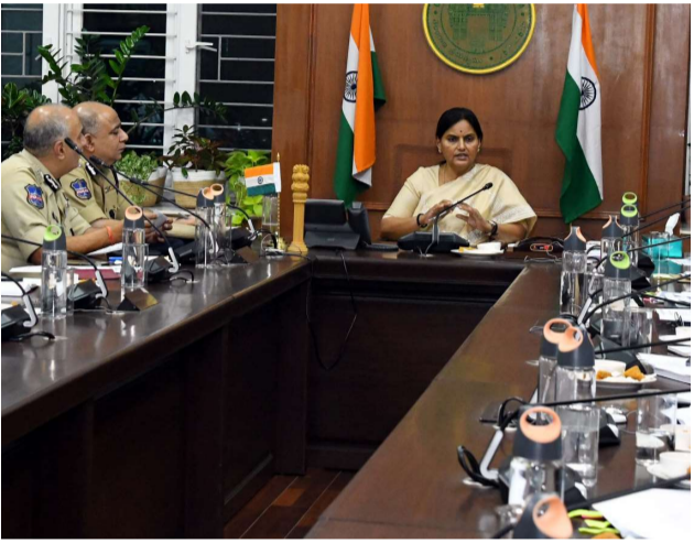
ఎలాంటి పొరపాట్లు లేకుండా చర్యలకు ఆదేశం

ఏర్పాట్లపై సిఎస్ శాంతికుమారి ఉన్నతస్థాయి సమీక్ష