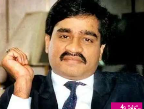
అధికారికంగా ప్రకటించిన లేదు. సంబంధిత అనుబంధంలో గట్టి నిఘా ఉంచినట్లు తెలుస్తోంది. 1993 ముంబై పేలుళ్ల సూత్రదారు, భారత్ మాస్టర్ వాంటెడ్ డాన్ దావూద్ ఇబ్రహీం చాలా సంవత్సరాలూ పాకిస్తాన్ లో ఉంటున్నాడు. ముంబై దారుల్లో 250 మంది ప్రజలు కోల్పోగా వేలాది మంది గాయపడ్డారు. ఈ

పాక్ లో ముందు జాగ్రత్తగా ఇంటర్నెట్ సేవల నిలిపివేత