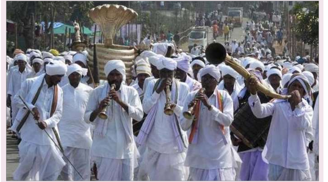
గంగాజలం కోసం మొస్తం వంశస్థుల యాత్ర ప్రత్యేక ఏర్పాట్లు చేస్తున్న అధికారులు