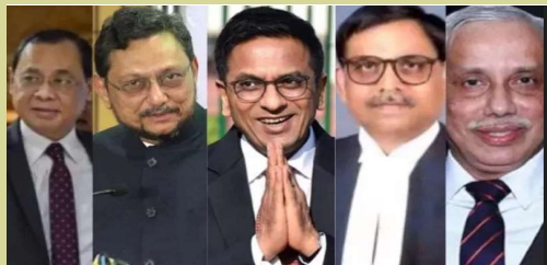
ఆయోధ్య, జనవరి 19 (సమ సమాజం): ఈ నెల 22న అట్టహాసంగా జరగబోయే ఆయోధ్య రామాలయ ప్రారంభోత్సవానికి అన్ని రంగాల ప్రముఖులు హాజరుకానున్నారు. శాజాగా రామ మందిరంపై చారిత్రాత్మక

సుప్రీం తీర్పు ఇచ్చిన జడ్జిలకు ఆయోధ్య ఆహ్వానం